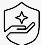
3 Jahre Abhol- und Lieferservice U1PS3E