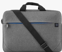
HP Prelude Laptop-Tasche (15,6 Zoll) 2Z8P4AA