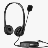
HP Stereo-USB-Headset G2 428H5AA