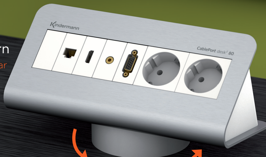
CablePort desk 2 80 turn Dreheinheit als Design- und Funktionserweiterung zu CablePort desk 2 80