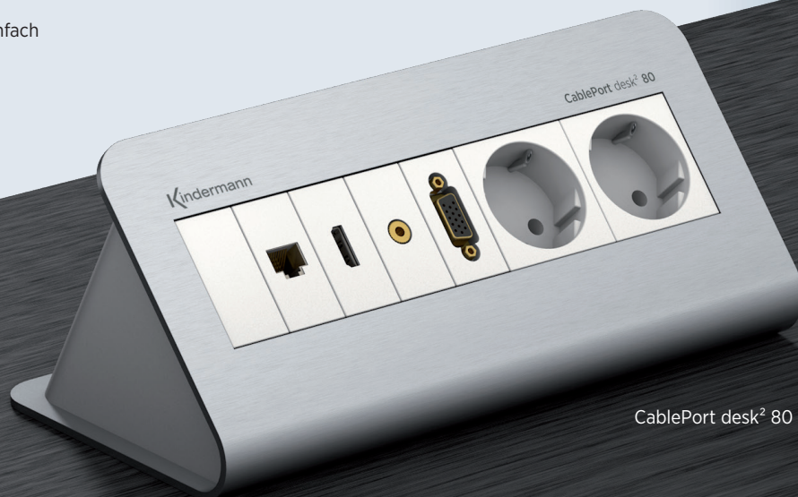
CablePort desk 2 80