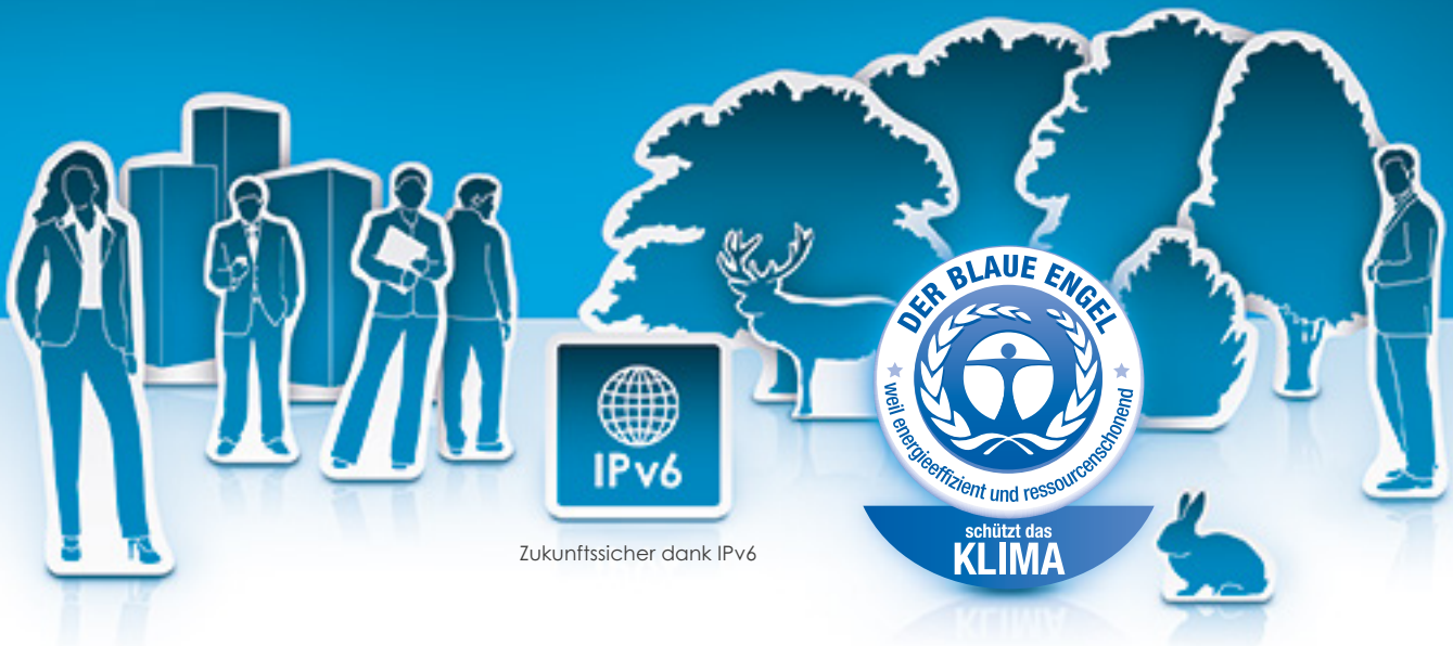
Zukunftssicher dank IPv6

Energieeffizient und ressourcenschonend: Der Blaue Engel für unsere COMcompact 5200/5200R.