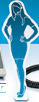
COMfortel 2600 IP mit COMfortel Xtension300 in Weiß