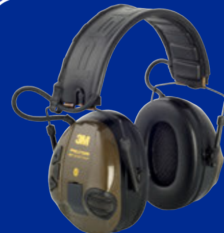
WS SportTac Light