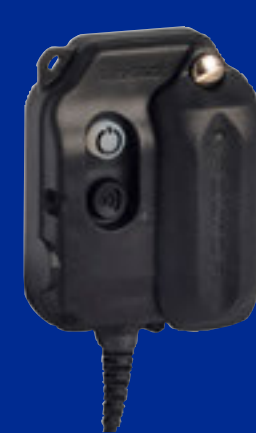
WS Adapter Flex