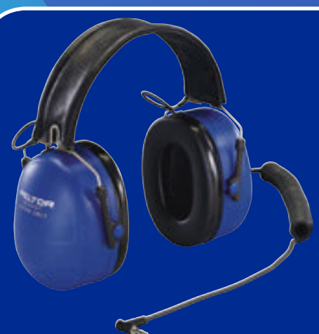
ATEX Listen Only