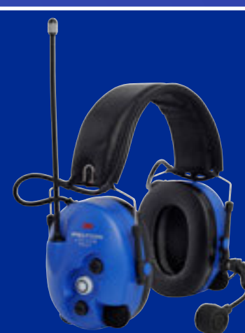
LiteCom Pro II ATEX