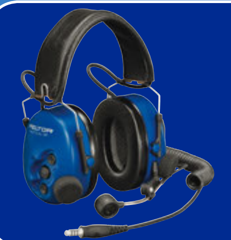
ATEX Tactical Headsets