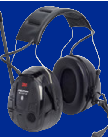
WS Alert XP