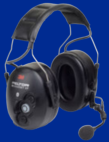
WS Headset XP