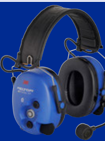
WS ProTac XP ATEX