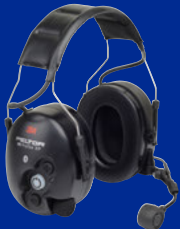
WS ProTac XP