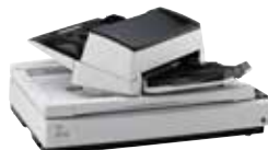
Bis zu 180° schwenkbarer Dokumenteneinzug

Das Designkonzept der beiden Modelle fi-7600 und fi-7700 ist praxisbewährt und ermöglicht die individuelle Anpassung der Scanner an die Vorlieben und Anforderungen der Nutzer. Der automatische Dokumenteneinzug des fi-7700 kann zu beiden Seiten verschoben werden und ist um 180 Grad drehbar.