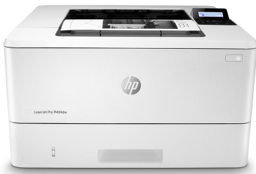
HP LaserJet Pro M404dw

Geschäftlich erfolgreich zu sein bedeutet, smarter zu arbeiten. Der HP LaserJet Pro M404 Drucker ist so konzipiert, dass Sie Ihre Zeit dort nutzen können, wo sie am effektivsten ist – und so zum Wachstum Ihres Unternehmens beitragen und gleichzeitig der Konkurrenz einen Schritt voraus sind.